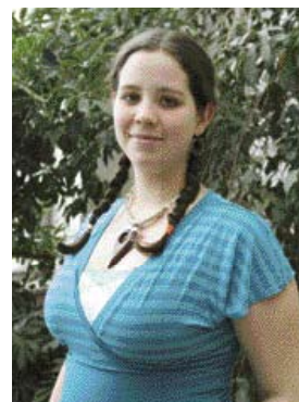
5 e secondaire École Pointe-Lévy CSDN