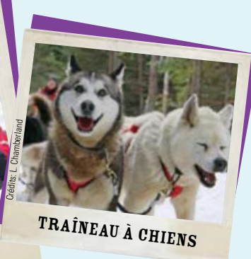
TRAÎNEAU À CHIENS